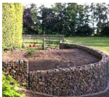
FirmusWAVE golvende schanskorven