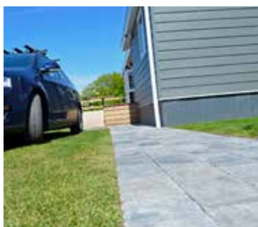
FirmusGRASS kant en klare grastegels