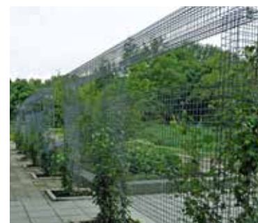
FirmusPERGOLA zuilvormige schanskorven